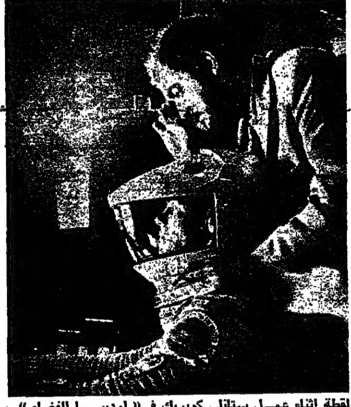
لقطة أثناء عمل ستاتلي كوبريك في « اوديسا الفضاء » .

وفي « حرب النجوم » يصنع جورج لوكاس معاملة ، اكثر تحذيرا في نظره للمستقبل القادم فهو في صراع الانسان مع الآلة المشخصة بكل مخترعاتها التكنولوجية الفائقة يجعل هذا الصراع ينتهي لصالح الإرادة الانسانية التي تمثل قوى الخير وذلك في معركة الطائرات الصغيرة مع الكوكب الصناعي الضخم والبيد والذي يدعى « نجمة الموت » اذ تفجر طائرة البطل الانساني واعتمادا على ارادته الانسانية ذلك الكوكب يكمله باستطاعة